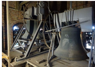
De klokken van de Sint Piterkerk.

Op 29 april jl. om vier uur twintig 's middags, luiden 420 klokken in Nederland voor 420 hier gewortelde kinderen die we niet willen laten gaan. PKN Gemeente Grou-Jirnsrum