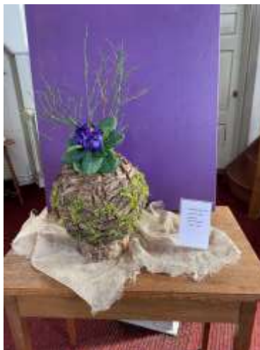
Liturgische bloemschikking voor de Mienskipsmiddag op 13 maart (Biddag).