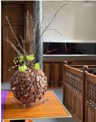
Liturgische bloemschikking voor de Eerste zondag van de veertigdagentijd, 18 februari.

Het 'zondagse boeket' ging als warme groet en ondersteuning naar: