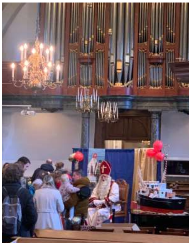
Op visite bij Sint Piter.