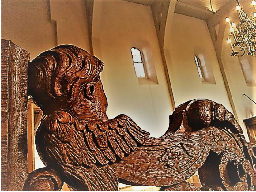
Het cherubijntje, waar ik in mijn kostersbank op uitkijk

ongeveer tot de provinciegrens. Positief gezegd: Fokke en mem en mijn beste vrienden binnen Volvo-bereik. Onafhankelijk van het OV. Heel fijn.